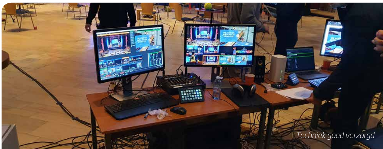
Techniek goed verzorgd

Ik werd naar de ruime koepelzaal, de vroegere kerkzaal, gebracht en keek mijn ogen uit.