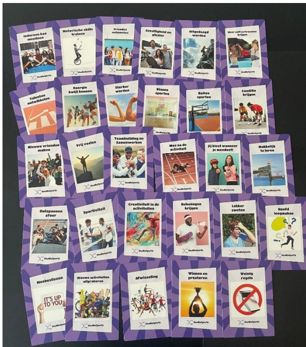
Figuur 2. Gesprekskaartjes jongeren

De sessie met jongeren werd in alle gevallen gestart met de vraag 'waar denk je aan bij sport en bewegen?'. Vervolgens kregen jongeren kaartjes voorgelegd, waarop telkens een (randvoor-)waarde rondom sport en bewegen stond beschreven (Figuur 2). Zij gaven per kaartje aan of zij de (randvoor-)waarde op het kaartje 'niet belangrijk', 'neutraal' of 'belangrijk' vonden en lichtten hun keuze toe. De reacties van de jongeren werden genoteerd. Vervolgens legden zij het kaartje op een vel met de drie categorieën. Deze aanpak stemt overeen met de 'Personal Values Card Sort', een Motivational Interviewing activiteit ontwikkeld door Miller (Miller et al., 2001). Er is gekozen om jongeren in groepjes van twee of drie te laten werken, om de opdracht laagdrempelig en minder spannend te maken. De individuele meningen zijn uiteindelijk meegenomen in de analyse.