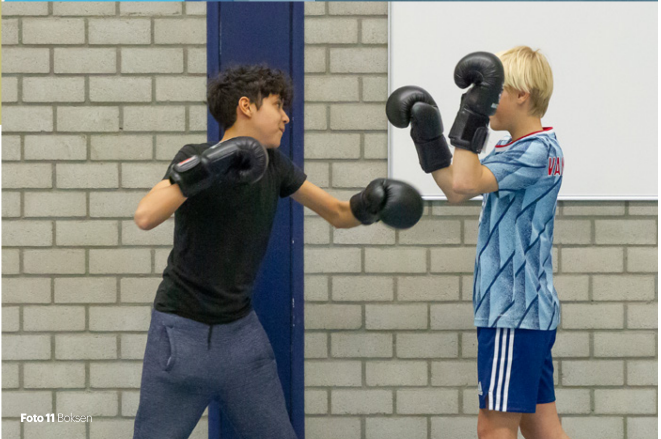
Foto 11 Boksen