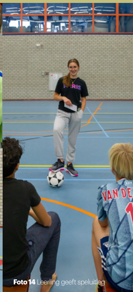
Foto 14 Leerling geeft speluitleg

De thermometer wordt ook in de klas opgehangen en tijdens de theorievakken gebruikt. Op deze manier gaan leerlingen in verschillende situaties nadenken waar ze staan in hun emotie.