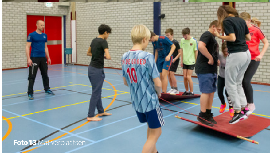
Foto 13 Mat verplaatsen