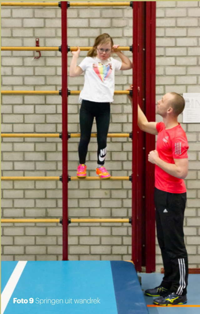
Foto 9 Springen uit wandrek