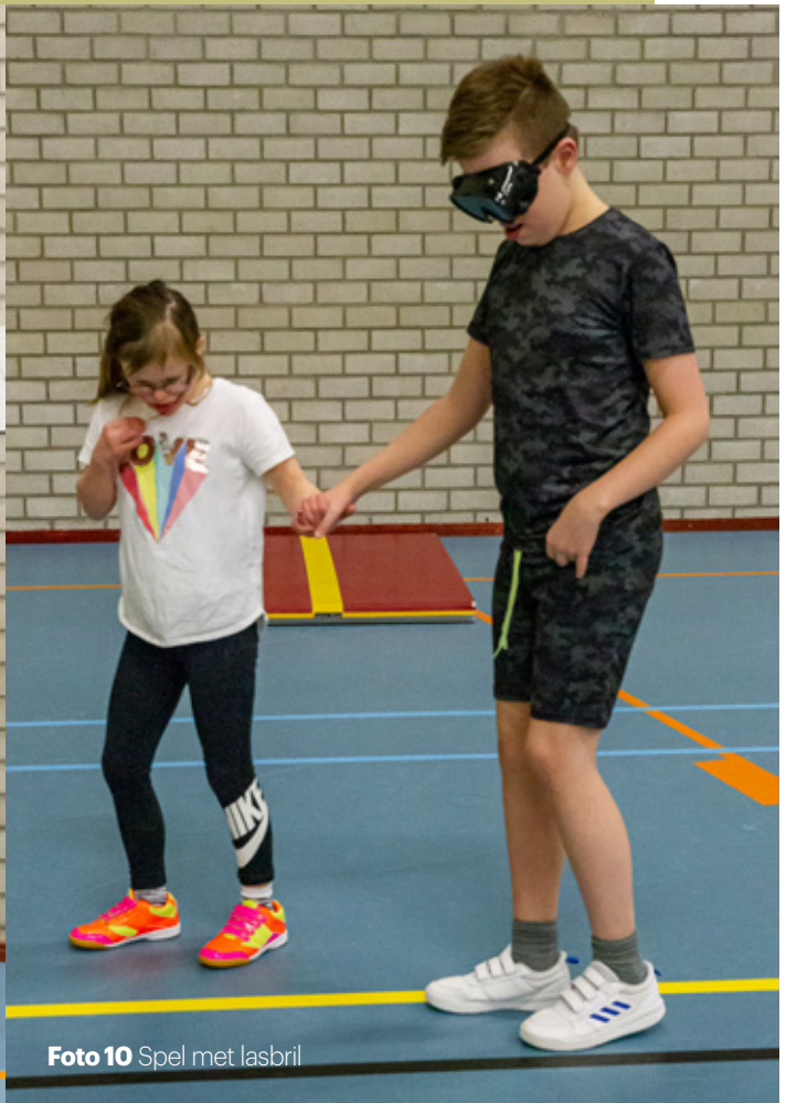
Foto 10 Spel met lasbril