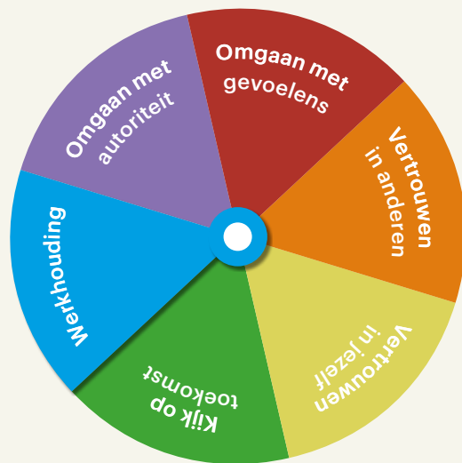
Figuur 1 Cirkel van Ontwikkeling

over zijn/haar eigen sociale ontwikkeling. De lessen zijn speels, visueel ondersteund (met posters, filmpjes en leskaarten) en afwisselend.