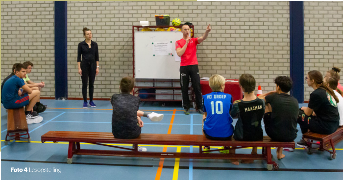
Foto 4 Lesopstelling

elkaar wordt gestimuleerd, maar ook pesten en negatieve opmerkingen naar elkaar komen aan de orde.