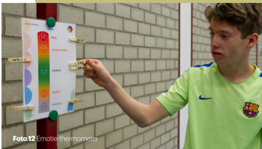
Foto 12 Emotie-thermometer