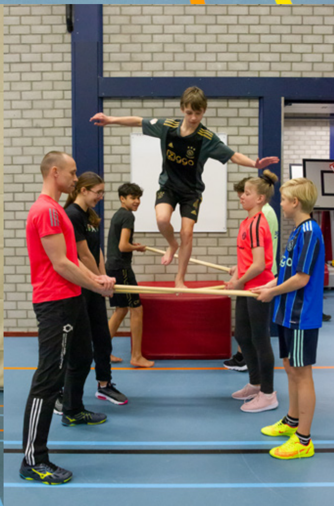
Foto 6, 7 en 8 Bank klimmen, lopen over stokken of kruitragen